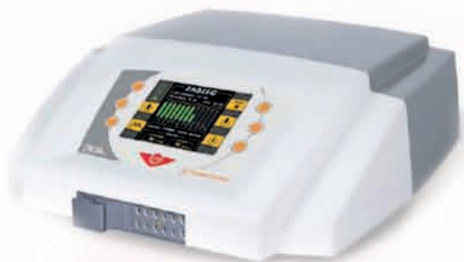
BOA Max ۲ با ۲۴ خروجی

درناژ لنفاوی با استفاده از دستگاه BOA تنها دستگاه ماساژ Vodder برای افزایش تغذیه ی بافت و سم زدایی