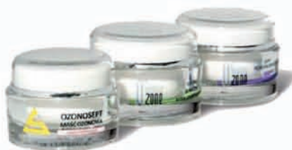
کاربرد ژل آنتى سلوليت