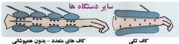
کاف های متعدد - بدون همپوشانی

مزایای درناژ لنفاوی با دستگاه BOA: • درناژ لنفاوی مطابق با روش بهینه ماساژ Vodder و کنترل جداگانه کاف های فشار • افزایش گردش خون و سیستم لنفاوی و در نتیجه: • روشی عالی برای برای حذف مواد زائد از بدن (سم زدایی) • بهبود غذا رسانی و اکسیژن رسانی به سلولهای بدن • تسهیل نقل و انتقال گلبول های سفید خون و بهبود سیستم ایمنی بدن • کاهش آمبولی و ادم (ورم) • کمک به کاهش وزن • افزایش اثربخشی های سایر درمان های لاغری (مانند رژیم های سم زدا، لیپولیز و کویتیشن) • آرامش بخشی عمیق و اصلاح الگوی خواب • بهبود ظاهر پوست